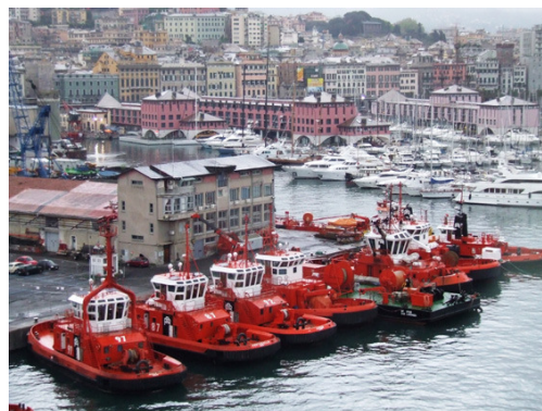
Rimorchiatori nel porto di Genova

garantendo i massimi standard qualitativi e professionali dei nostri servizi". La Rimorchiatori Riuniti Panfido è concessionaria del servizio di rimorchio nei porti di Venezia e di Chioggia ed opera presso la piattaforma offshore Adriatic LNG attraverso una controllata.